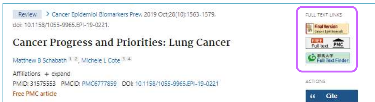
図 7.5 PubMed に表示されたリンクアイコン

「医中誌 Web」「PubMed」「Web of Scicene」「CINAHL」など、文献検索データベースの検索結果には右図のような「Full Text Finder アイコン」や電子ジャーナルへのアイコンが表示されます。このアイコンからフルテキストにアクセスできる場合もあります。