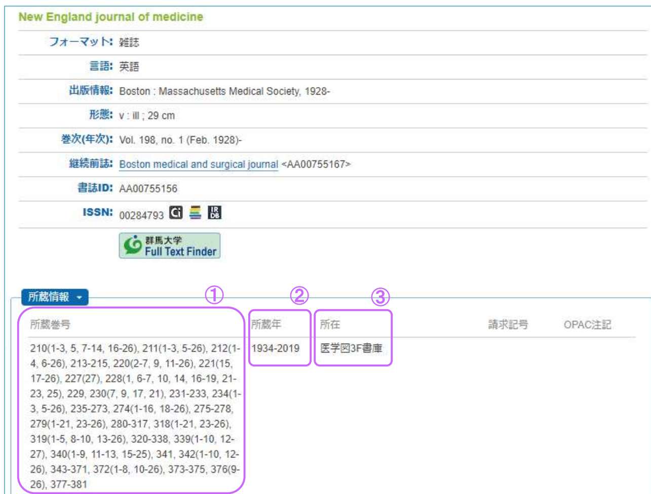
図 3.5 詳細情報画面（雑誌）

雑誌も図書と同様の方法で検索できます。検索ボックスに雑誌名（略誌名でも可）や出版者名などのキーワードを入力します。正確な雑誌名がわからないときは「New England J*」のように末尾に「*」を付けることで、前方一致での検索もできます。