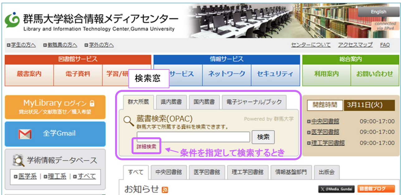
図 3.2 群馬大学図書館 OPAC の検索窓

OPACの検索窓は総合情報メディアセンターのトップページにあります。タブを切り替えると、群馬県内図書館の横断検索、CiNii Booksの検索、電子ジャーナル及び電子ブックの検索もできます。