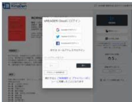
bREADER Cloudアカウント作成・ログイン画面例 Google, Twitter, Facebookアカウントも利用できます。