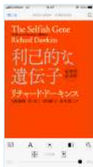
電子書籍の閲覧例