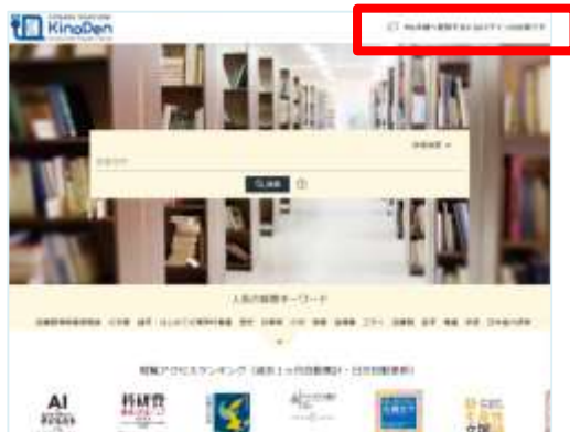
トップ画面からもログインできます。

(注意) 定期的にブラウザからKinoDen電子図書館サイトへのアクセスが必要です。 ※KinoDen 電子図書館サイトに長期間アクセスしていない場合は、アプリから電子書籍を開くときに(Step6参照)、KinoDen 電子図書館サイトへのアクセスとbREADER Cloudアカウントへのログインが必要となります。