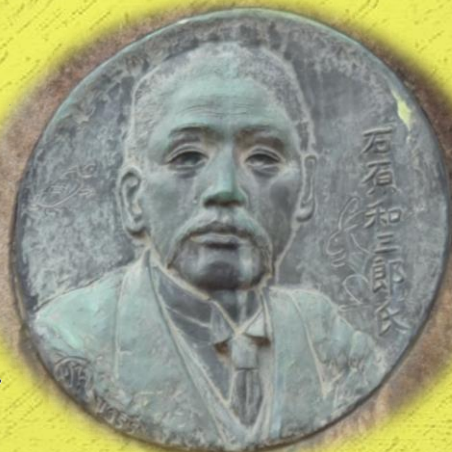
教育学部前の歌碑より